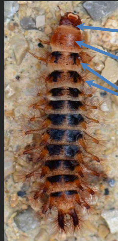
Drilus flavescens , 3. Larvenstadium

Flecke auf dem 2. und 3. Thorax-Segment tief eingekerbt